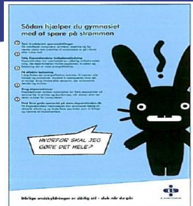
5 gode råd - plakat