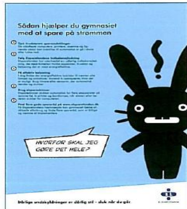
5 gode råd - plakater