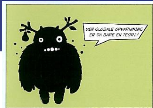
Postkort, 2 varianter