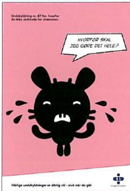
Plakater til lokaler, 6 varianter