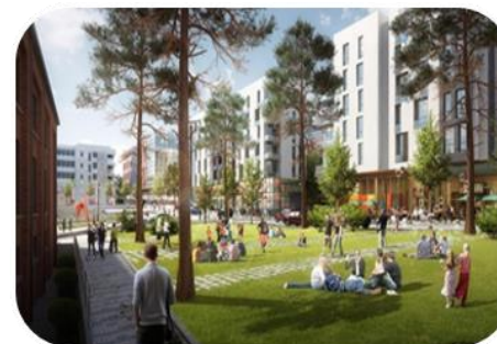
Bygningers sociale funktion