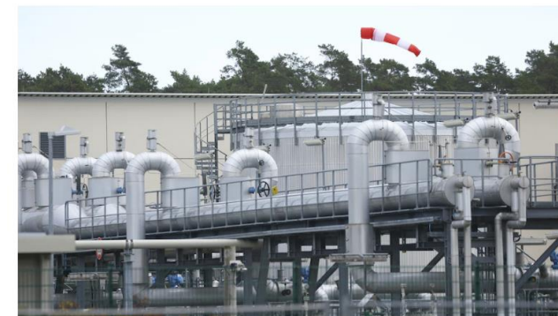
Nord Stream 1 i Tyskland

27. sep. 2022, 08:37 Opd. 27. sep. 2022, 10:00